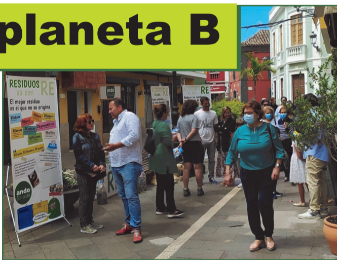
El 5 de junio, Día Internacional del Medio Ambiente, en la calle Tenderete

Recogemos en tres lonas de manera muy sencilla y esquemática aquellos pequeños gestos que puede hacer cada persona desde el compromiso personal con el medio ambiente. En la primera hablamos del reciclaje, de la separación de residuos y su importancia para recuperar muchos materiales y usarlos nuevamente. En la segunda hablamos de las aguas residuales, de cómo son el cauce por el que llegan al mar gran cantidad de residuos, generando auténticas islas de plásticos en medio de los océanos. De las toallitas y el gravísimo problema que están generando en nuestras redes de saneamiento. Y en la tercera lona tratamos la necesidad de reducir residuos con la cesta de la compra, con productos de cercanía, con envases retornables, o llevando nues-