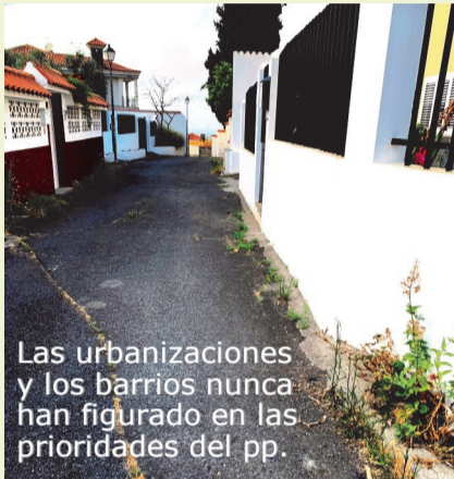
Las urbanizaciones y los barrios nunca han figurado en las prioridades del pp.

Donde lo que importa es la apariencia de