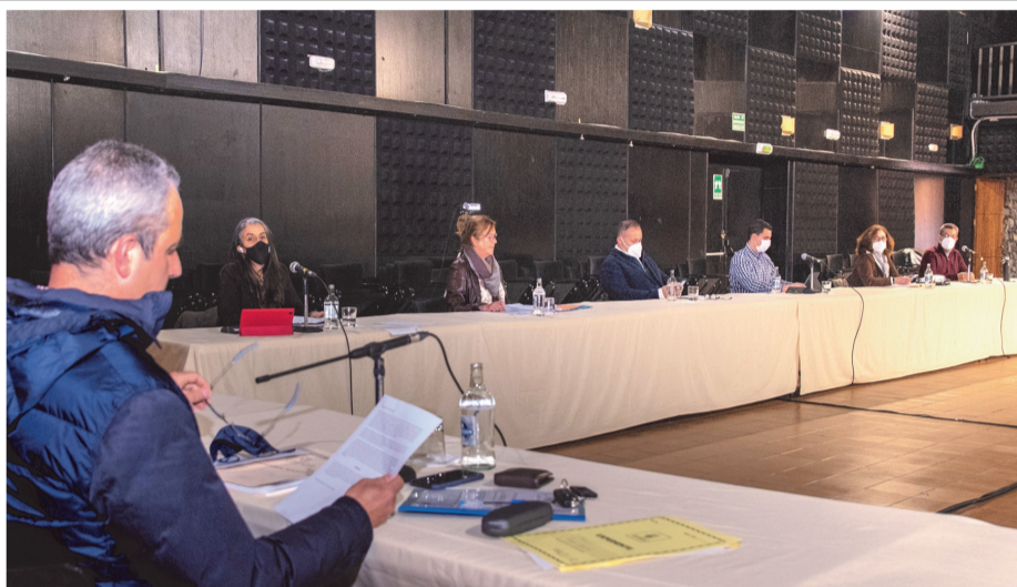
Imagen de un pleno municipal en el Centro Cultural de la Villa de Santa Brígida.

Algunas preguntas se nos ocurren para el alcalde y el responsable de deportes, sin esperanza de obtener respuestas, como ya es habitual. ¿Cómo va a acceder la ciudadanía no federada a estos equipamientos? ¿Qué usos se le va a dar, aparte de los entrenamientos de los clubes? ¿Cómo y quién los va